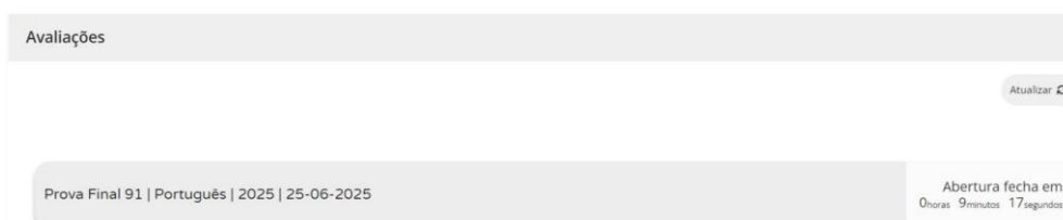
Figura 4 – Acesso à prova a realizar

11.6. Nas provas, ao clicar em “Iniciar sessão”, por exemplo, para um aluno que realiza a prova final de Português (91), aparece o seguinte ecrã: