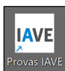
Figura 1 – Aplicação de acesso à plataforma das provas