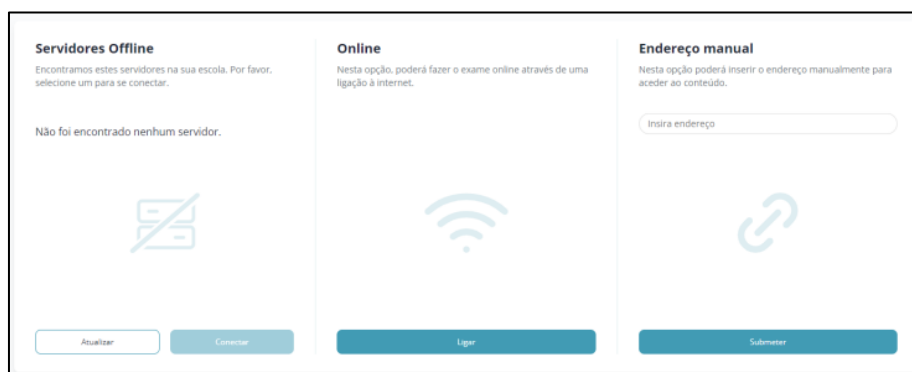
Figura 2 – Opções de utilização da aplicação